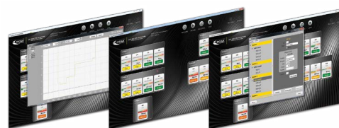
DEGA VISIO III vizualizační software