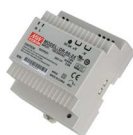
Přídavný zdroj: DR60/24 DR100/24 DR240/24